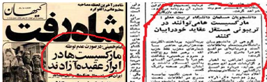
روزنامه‌ی کیهان، ۲۶ دی ۱۳۵۷: ۱

آزادی تلقی می‌شد (همایون، ۱۳۸۳: ۶۹) و حوزه و دانشگاه با هم در اتحاد برای مخالفت با علوم انسانی غربی قرار داشتند و مارکسیست‌ها و ملی‌گرایان یک متحد به شمار می‌رفتند (Zonis, 1971: 12). و زمانی که این اتحاد مبدل به اختلاف افتاد، آغازی برای انقلاب فرهنگی شد.