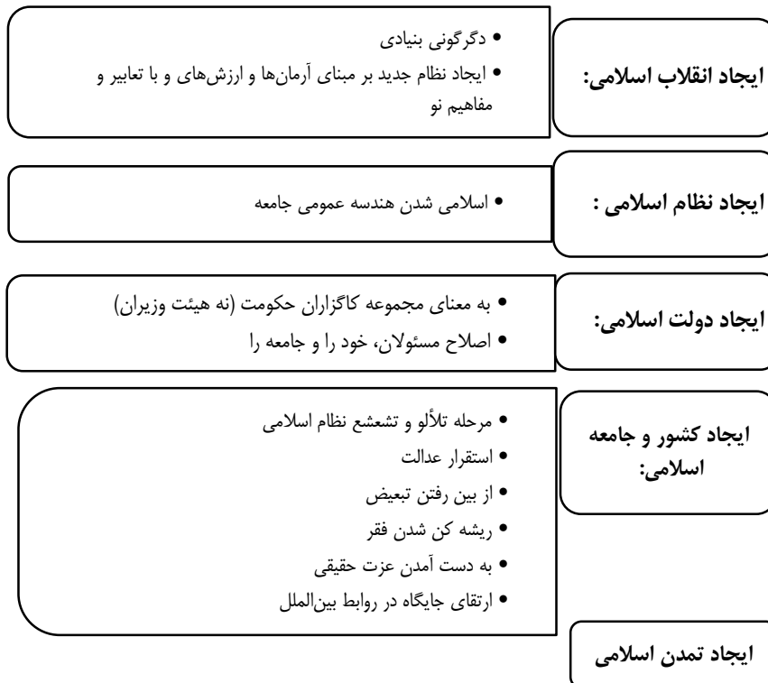
شکل ۳: مراحل شکل‌گیری تمدن اسلامی

رهبر معظم انقلاب، تمدن‌سازی اسلامی را مستلزم طی شدن مراحل می‌داند و به فرایند شکل‌گیری تمدن اسلامی اشاره می‌کند؛ ایجاد انقلاب اسلامی، ایجاد نظام اسلامی، ایجاد دولت اسلامی، ایجاد کشور و جامعه اسلامی و ایجاد تمدن اسلامی، فرایندی است که برای شکل‌گیری تمدن اسلامی باید طی شود. در شکل ذیل فرآیند شکل‌گیری تمدن اسلامی آمده است: