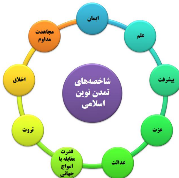
شکل ۴: شاخصه‌های تمدن نوین اسلامی

در شکل ذیل شاخصه‌های تمدن نوین اسلامی آمده است: