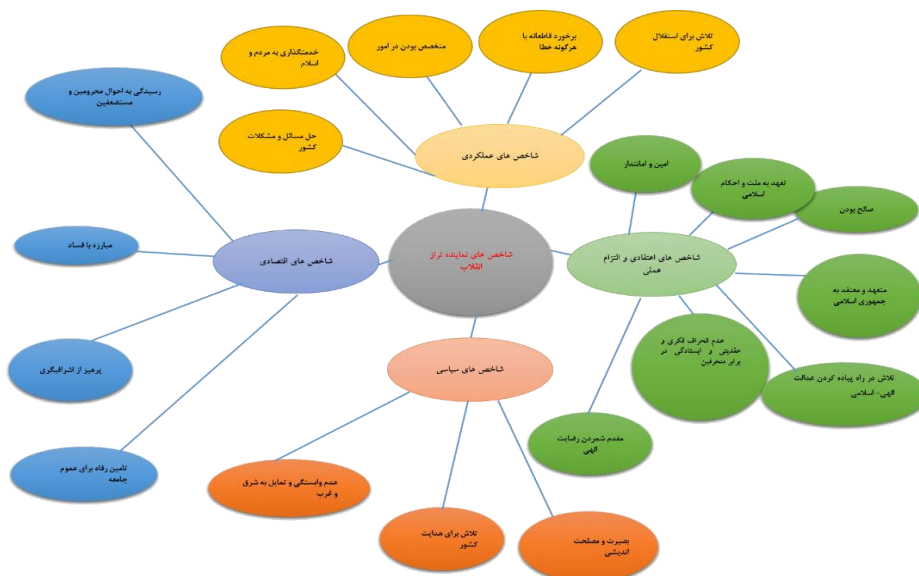
نمودار ۱: تدوین مضامین شاخص‌های نماینده تراز انقلاب اسلامی استخراج شده در نمودار به شکل شبکه مضامین