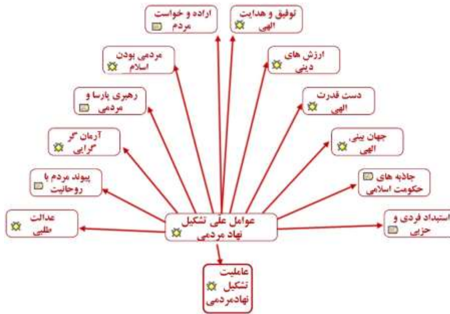
شکل ۱: نمونه‌ای از شبکه معنایی حاصل از پیوند کدها

حدود ۲۸ شبکه معنایی که در واقع محصول گره‌ها و پیوندهای بین کدهای باز و ترکیب و تجمیع آنها در گراف‌های تصویری است، شناسایی شد که شکل شماره ۱ نمونه‌ای از این شبکه‌های معنایی را نشان می‌دهد.