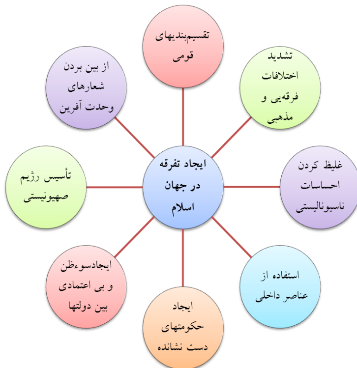
نمودار شماره ۱: روش‌های ایجاد تفرقه در جهان اسلام با تاکید بر نقش راهبردی و چند جانبه ناسیونالیسم منفی