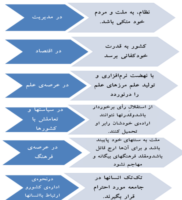
نمودار ۳: ابعاد عزت ملی

در اندیشه مقام معظم رهبری برای اینکه یک ملت بتواند به اقتدار ملی و آرمان‌های بزرگ معنوی و دنیایی، دست پیدا کند ضروری است ویژگی‌هایی را در هویت ملی خود به وجود بیاورد که برخی از این عناصر و شرایط عبارتند از: ایمان، احساس مسئولیت، شجاعت، اعتماد به نفس، پشتکار و تلاش (رک:بیانات، ۱۳۷۹/۰۸/۱۱). در یک کلام می‌توان این مداخل را در نمودار شمار ۴ به‌عنوان منظومه فکری مقام معظم رهبری در بحث معرفی یک هویت سازنده و بالنده به نمایش گذارد